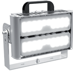
ALDEBARAN® RAPTOR RP1000 LED | RAPTOR RP1000 LED 24V RAPTOR RP2000 LED RAPTOR RP1000 LED FIRE | RAPTOR RP2000 LED FIRE