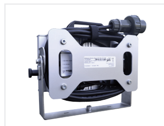
Der RAPTOR RP LED FIRE mit integrierter Kabelaufwicklung

* Lumen = Lm / Bei den „REAL Lumen“ handelt es sich um REAL gemessene Lichtaustrittsmengen.