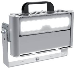
ALDEBARAN® RAPTOR RP500 LED